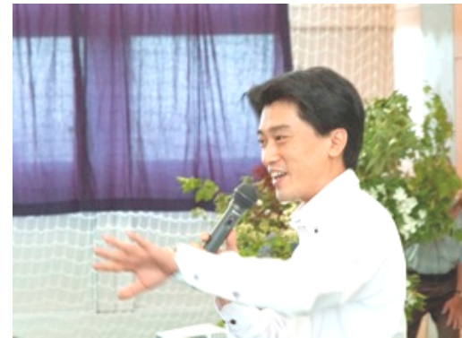
神山洋介衆議院議員